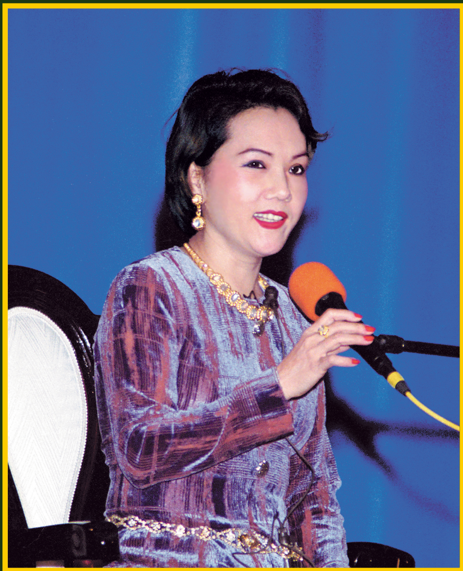
Төгс Гэгээрсэн Их Багш Чин Хай